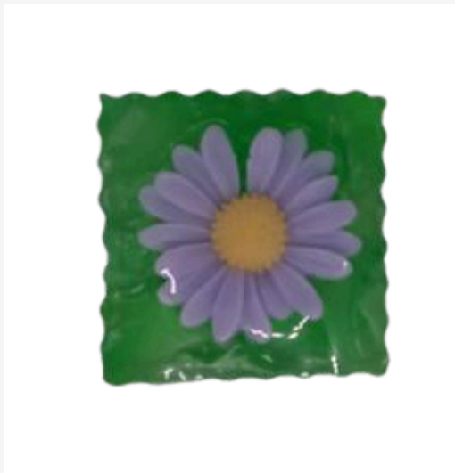
Jabón Margaritas para mi jardín - 150g.

Base de glicerina con propiedades: hidratante.