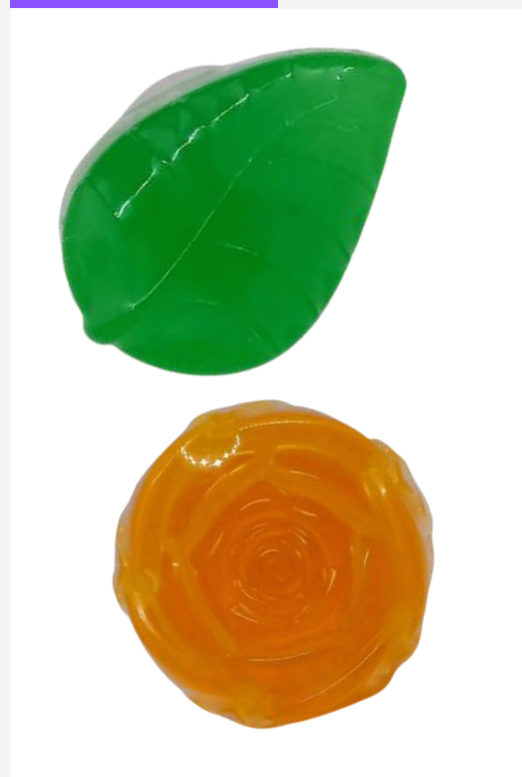
Jabón Rosa y hoja